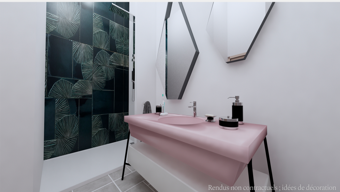
Rendus non contractuels ; idées de décoration