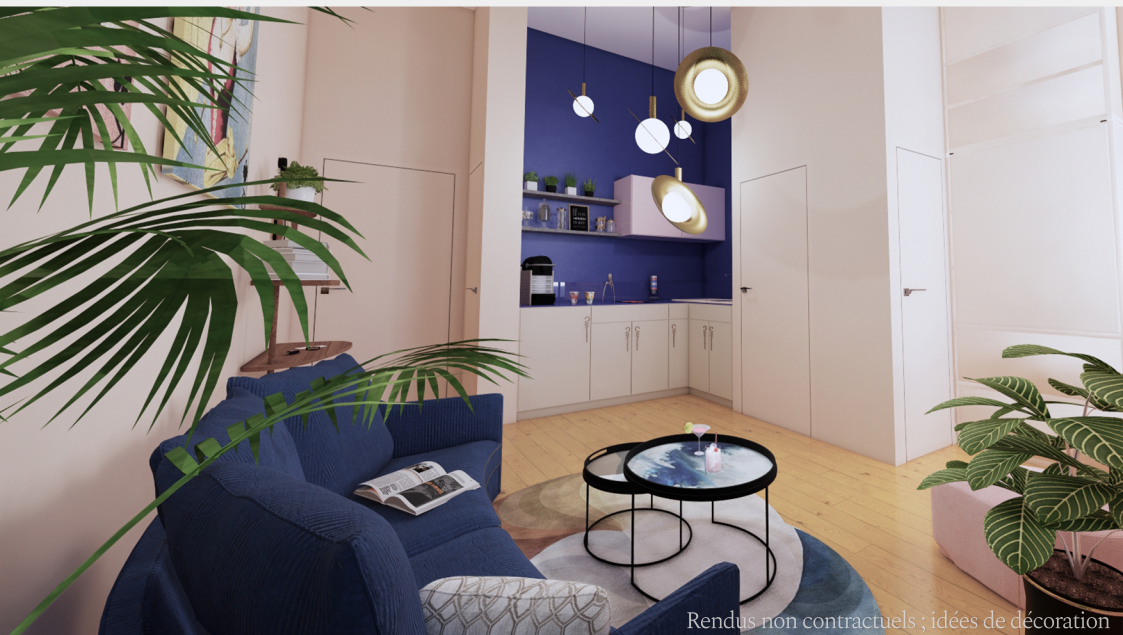
Rendus non contractuels ; idées de décoration